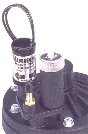
Tlakový regulátor ACCU SET