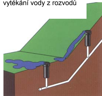
Příklady instalace zpětných ventilů dovnitř postřikovače

Postřikovače se zpětným ventilem ADV zabraňují vytékání vody z rozvodů