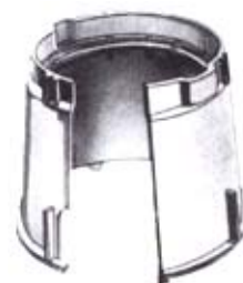
10" VB - 910