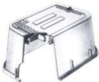
JUMBO VB -1220