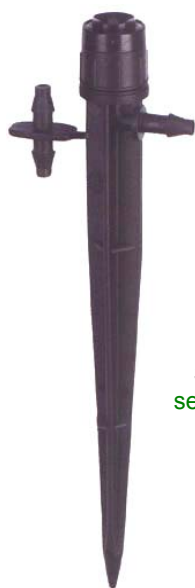
SPECTRUM (B) se zemním bodcem obj.č. : 45 992

Pokud je požadováno umístění mikrozavlažovače ve výšce několika desítek cm nad zemí (těsně nad výsadbou), lze použít SPECTRUM s integrovaným adaptérem s 1/2" vnitřním závitem, který se osadí na odbočku z potrubí vystupující kolmo ze země do požadované výšky. Obdobné řešení nabízí i SPECTRUM se závitem 4 mm, které se nainstaluje na plastový stojánek délky 30 nebo 45 cm.