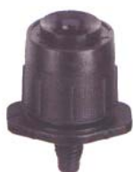
SPECTRUM (T) závitový hrot 4 mm obj.č. : 45 991