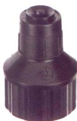
SPECTRUM s adaptérem 1/2" obj.č. : 45 993