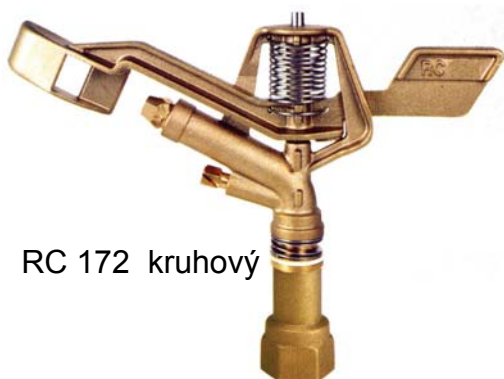
RC 172 kruhový